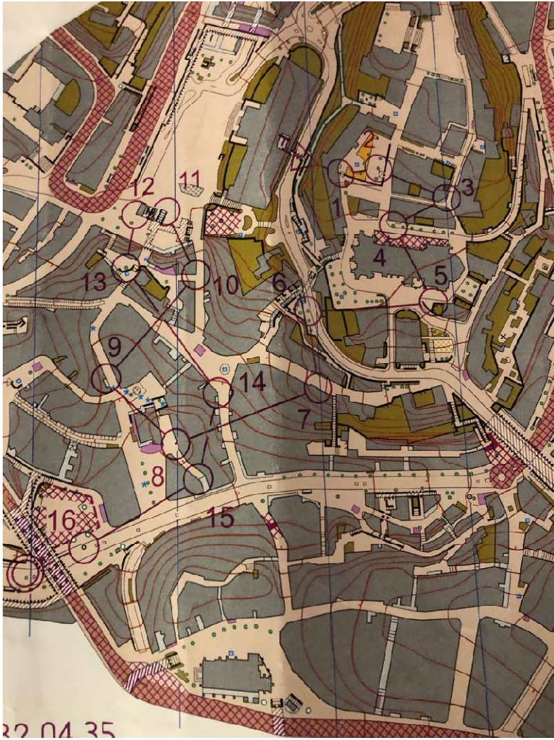
Laufkarte HAK / H70