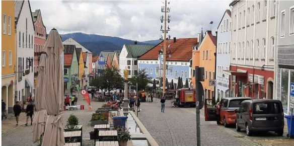
Lars im Zieleinlauf im schönen Städtchen Waldkirchen