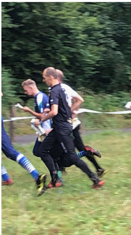
Mäse als Startläufer